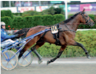
MISTER JP (US)