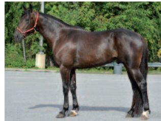
GOOGOO GAAGAA (US)

un grand nombres d'autre étalons disponible: nous consulter